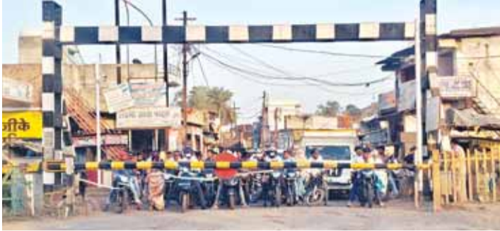
कारण दुर्घटना की संभावना भी बनेगी।

सिहोरा। रेल प्रशासन द्वारा रेलवे फाटक संपर्क फाटक 336 / 12 29/ 22- 24 को दिनांक 23.4. 26 समय 5:00 बजे से यातायात हेतु बंद करने का पत्र जारी किया गया है। नगर पालिका क्षेत्र अन्तर्गत फाटक के उस पार वार्ड क्रमांक 16 ,17 एवं 18 की सघन बसाहट है इसके अलावा हायर सेकण्डरी स्कूल एवं नगर का एक मात्र महाविद्यालय के अलावा सी एम राइज विद्यालय भी निर्माणाधीन है। लगभग 10 हजार की बसाहट के लोगों को बाजार आने जाने हेतु भारी परेशानी का सामना करना पड़ेगा इसके अतिरिक्त छोटे बच्चे पैदल तथा साइकल से दोनों तरफ से स्कूल आते जाते हैं और पैदल ही फाटक को क्रॉस करते हैं उन्हें भी अधिक परेशानी होगी। क्वीकी नवनिर्मित आर ओ वी से जाने में लगभग 3 किलोमीटर का लंबा चक्कर लगाकर बाजार स्कूल आना पड़ेगा जिसमें समय समय अधिक लगने के साथ साथ भारी वाहनो के आवागमन के